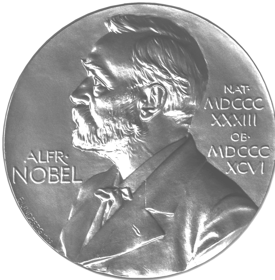
Médaille Prix Nobel