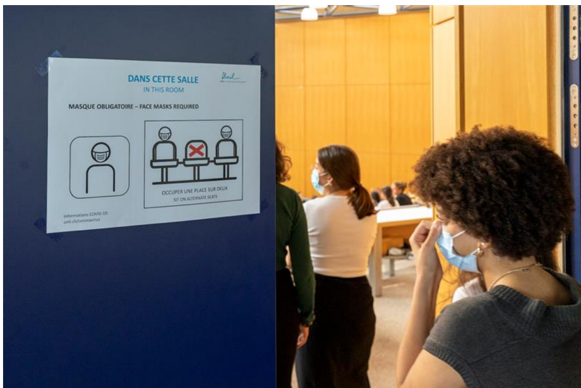
Fabrice Ducrest © UNIL