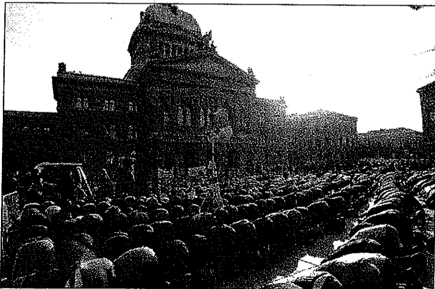
11.02.2006: Des musulmans manifestent devant le Palais fédéral. Ils réclament une restriction de la liberté d'expression «par égard aux musulmans» (après l'affaire des caricatures au Danemark).

Le Constitution fédérale suisse protège la liberté de conscience et de croyance (art. 15 cst.).