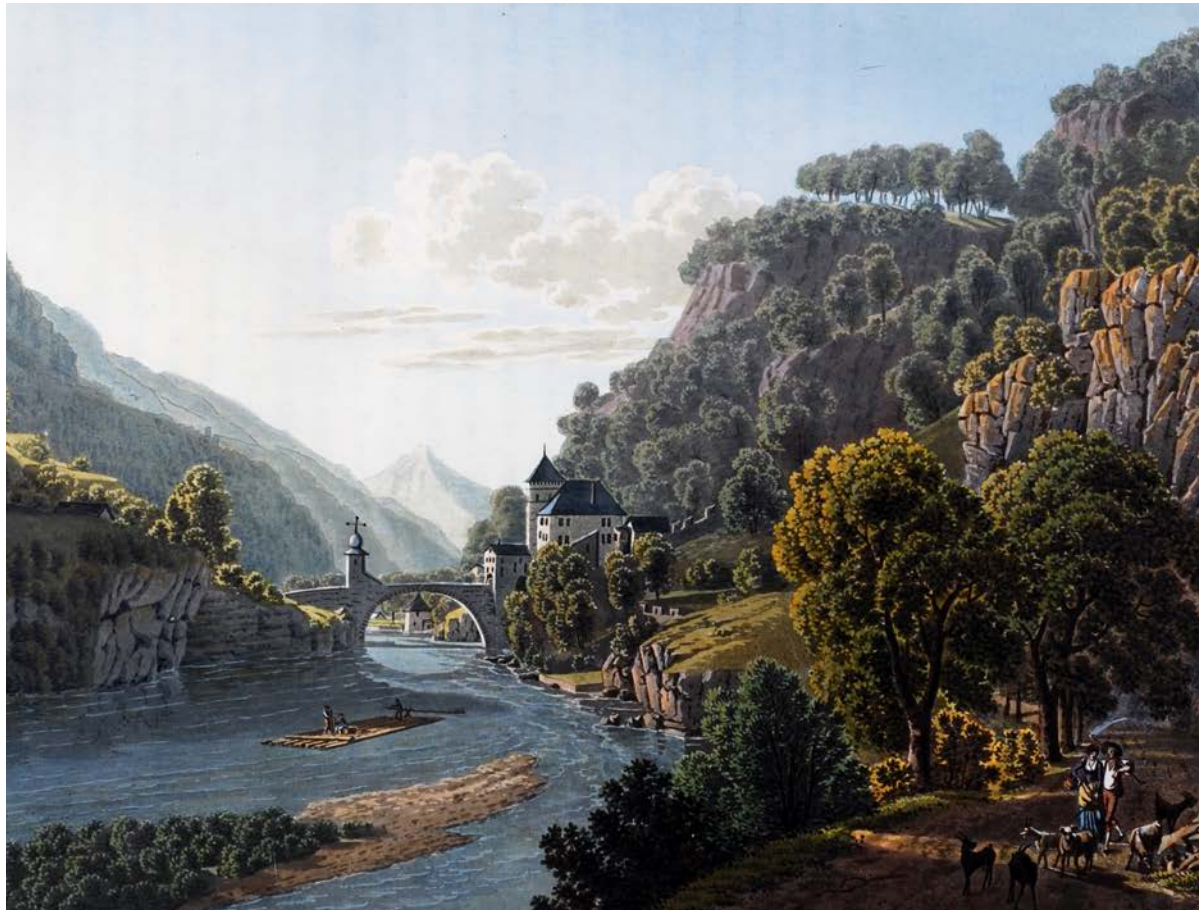
Gravure de Mathias Gabriel Lory reproduite dans « Voyage pittoresque de Genève à Milan », Paris, 1811

12 ème colloque sur le RHÔNE dans son environnement naturel et humain