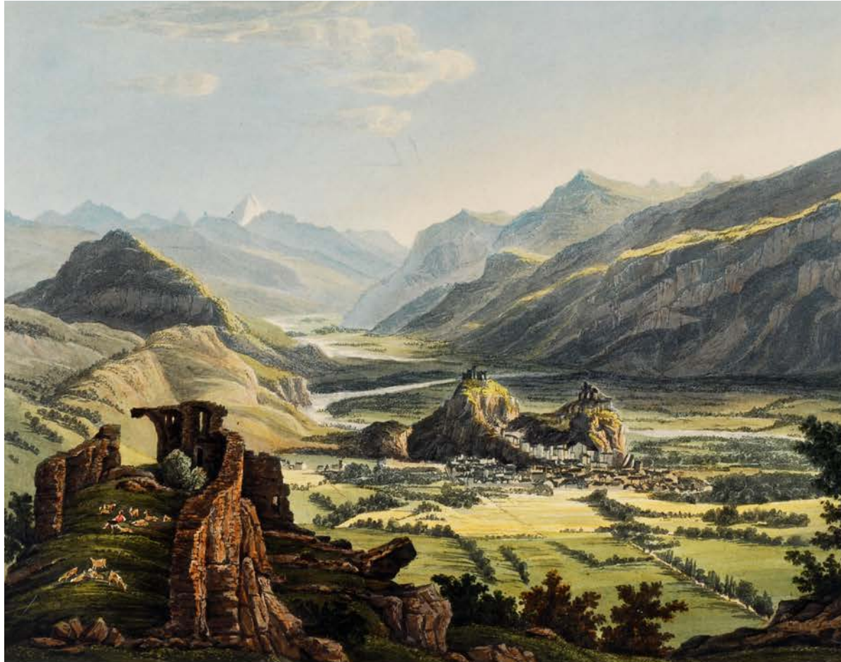
Gravure de Mathias Gabriel Lory, 1829

14 ème colloque sur le RHÔNE dans son environnement naturel et humain