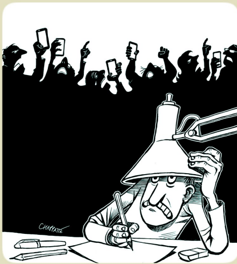
© Chappatte pour la une de Libération, France, 22 juin 2019